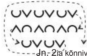
Jn. 2ja kõnnivad raskete

jalaga alustades liiguvad tantsijad voorina 21 kõnni- ja lõppsammuga päripäeva ringjoonele. Vedajaks on I viiru otsmine poiss (jn 2). Liikumine lõpeb päripidises sõõris (jn 3). Taktid 9-10 (Kive nüüd kokku kandke,). Tantsijad teevad kolmveerandpöörde päripäeva